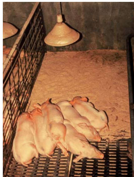
Situación de disconfort (placa demasiado caliente)

En muchas ocasiones nos encontramos que, a pesar de que el termómetro marca una temperatura que creemos adecuada, los animales no están bien. ¿Por qué sucede esto?