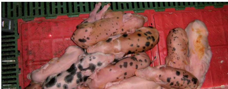
Situación de disconfort (placa fría)