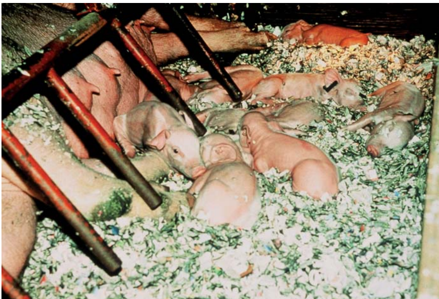
Situación de confort térmico 2

animal. Cabe decir que éste no es el único factor, es por esta razón que muchas veces apreciamos la temperatura correcta pero los animales no lo manifiestan del mismo modo.