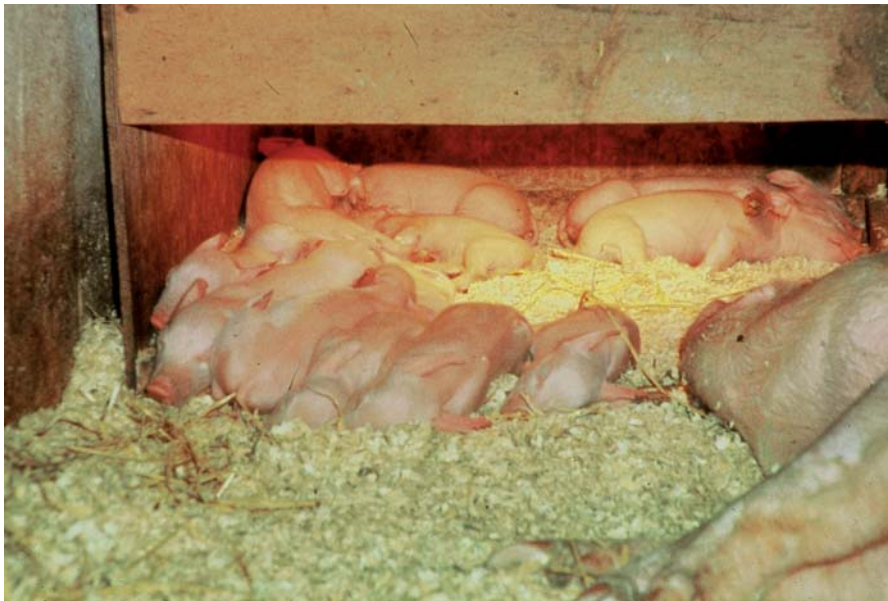
Situación de confort térmico 1

De ahí que tengamos que hablar de temperatura de sensación, es decir una cosa será el valor que marcará el termómetro y otra muy diferente es lo que nosotros o los cerdos percibiremos, precisamente esta percepción es lo que llamamos temperatura de sensación.